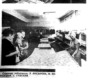
... (caption text) ...