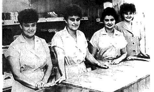
... (caption text) ...