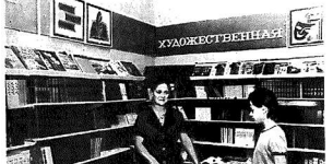
... (caption text) ...