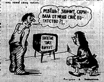
Первый шаг к... (Caption for the cartoon)