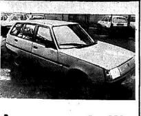
Второе дыхание «АвтоЗАЗа»