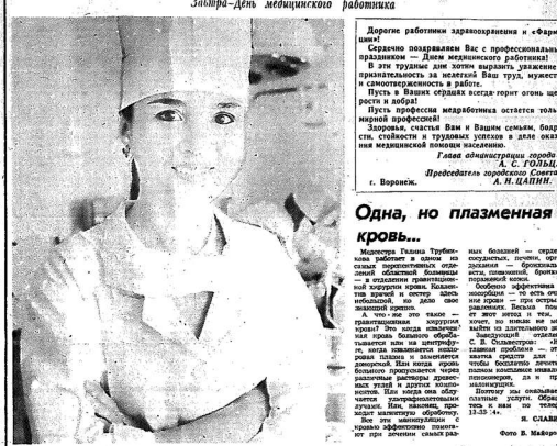
Забора-День медицинско работника

Дорогие работники здравоохранения и «Фрам-И»! Сердечно поздравляем Вас с профессиональным праздником — Днем медицинского работника!