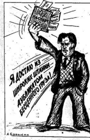
Я достану... (Cartoon text)

Стихи — это не только поэтический талант, а сила, которая способна изменить мир. И действительно, Маяковский — это не только поэт, но и человек, который своим творчеством изменил мир.