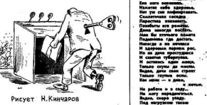
Рисует Н. КИНАРОВ