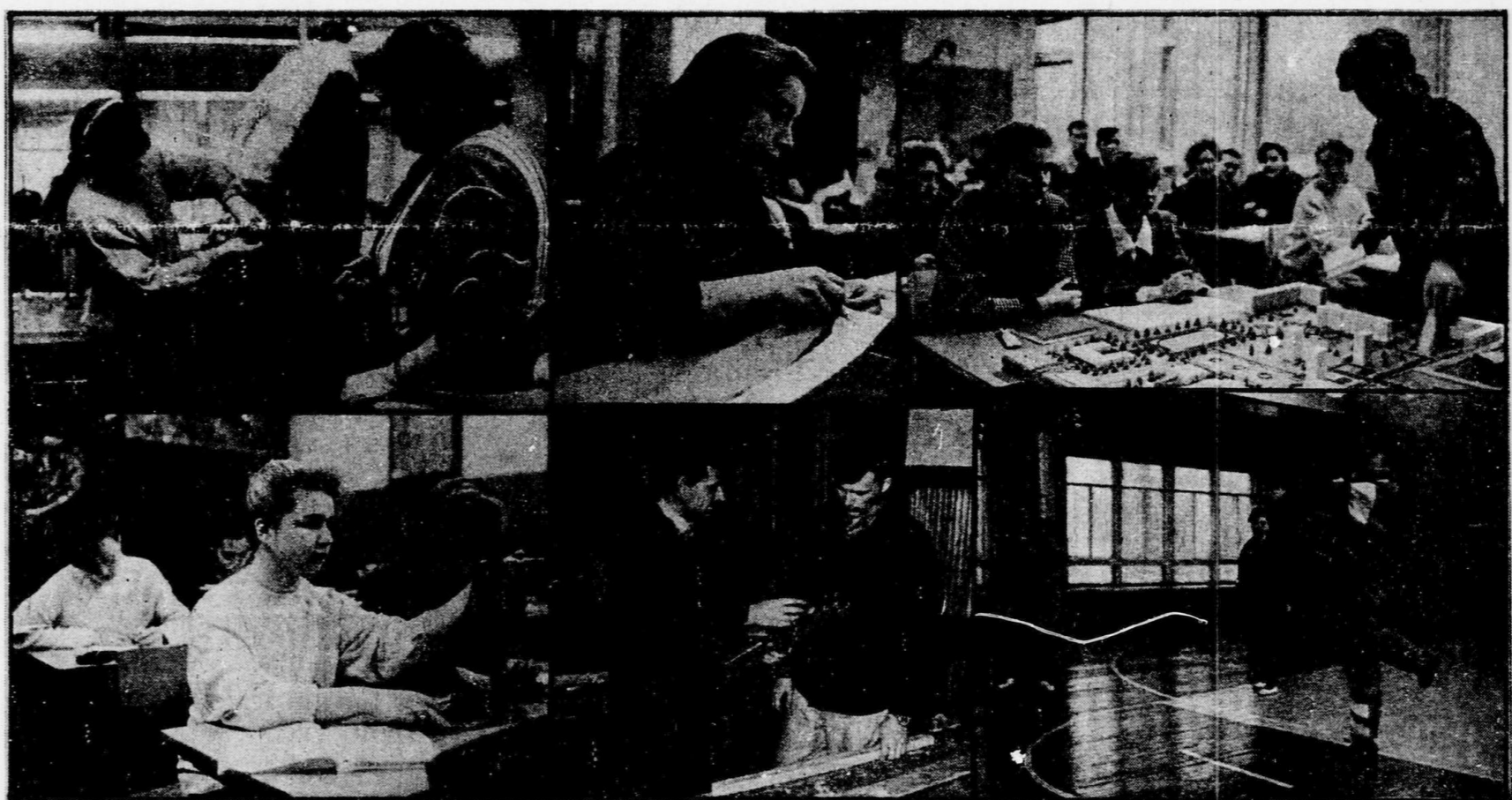
(Материал о жизни Воронежского индустриально-педагогического техникума читайте на 2-й странице).