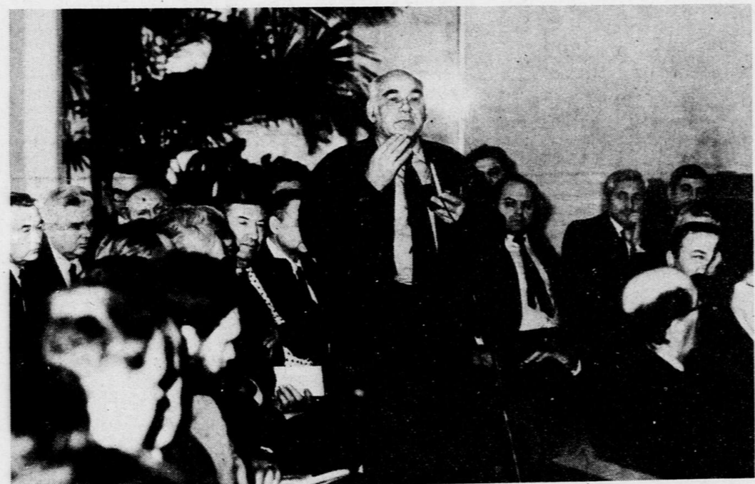
Из записок фронтовых

Где саказов, там обычно и винокурня. Ольховатка — не исключение. Здешний самогон был издан в цене. Но иные времена — иные и подпольные ремесла. В райцентре задержаны местные жители уже с наркотическим зельем. В их «Жигулях» обнаружено пять килограммов злого саказова из кустрого производства из конопля и мака. П. ЧАЛЫЙ.