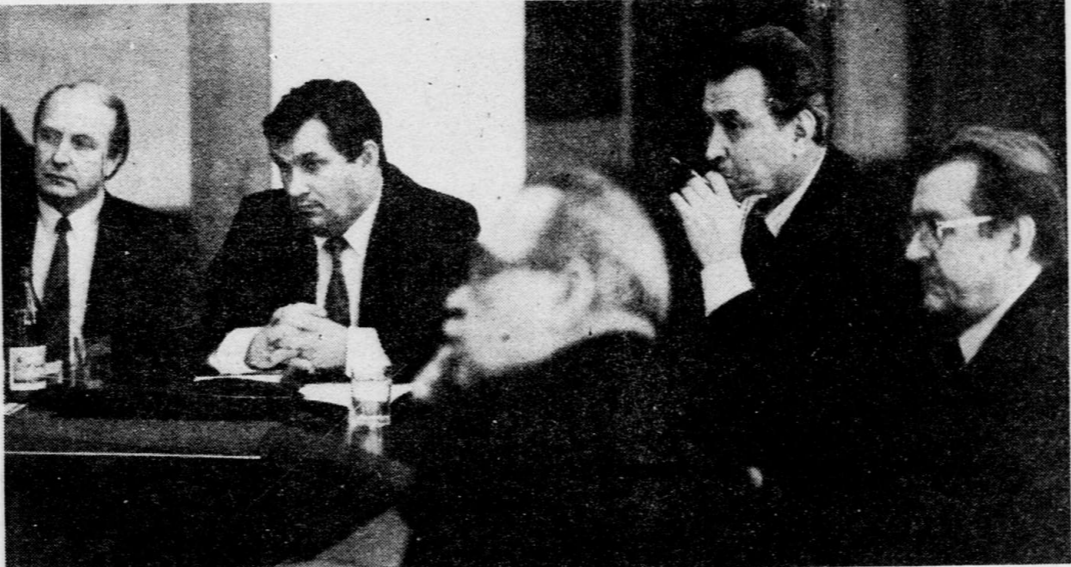
О том и шел разговор на встрече.

Из перечисленного видно, что воронежская диаспора в Москве имеет большой потенциал и возможности делом помогать отечеству.