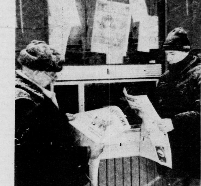
Воронежский курьер.