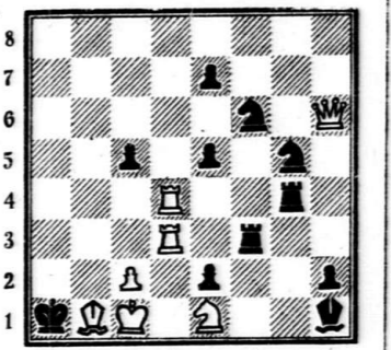
Белые начинают и дают мат в три хода.

Прежде всего сообщаем авторское решение трехходовой шахматной задачи Алексея Копнина, помещенной в «Коммуне» 15 января (основные варианты): 1. Лf7 с угрозой 2. Лd5+ еd 3. Лe7X. Если 1... Сd8, то последует 2. Кa7 и 3. КсdX; в случае 1... Сd6 белые играют 2. Кa3 и 3. Кс4X; на ход 1... Сf8 последует 2. Кf4 и 3. Кg6X; если 1... Сf6, то 2. Кf2! и 3. Кg4X; в случае 1... Сg5 черный король матуется ходами 2. Кg1 и 3. Кf3X. Ложные следы опровергаются так: 1. Кa7? — Кd8!; Кa3? — Кd6!; 1. Кf2? — Кf6!; 1. Кf4? — Кf8! Фамилии читателей, первыми приславших в редакцию верные ответы, будут опубликованы в следующем выпуске шахматной рубрики. А пока вниманию любителей древней игры предлагается задача немецкого шахматного композитора Ф. Метценуэра.