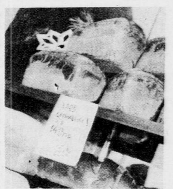
На снимке: в фирменном магазине «Каравай».