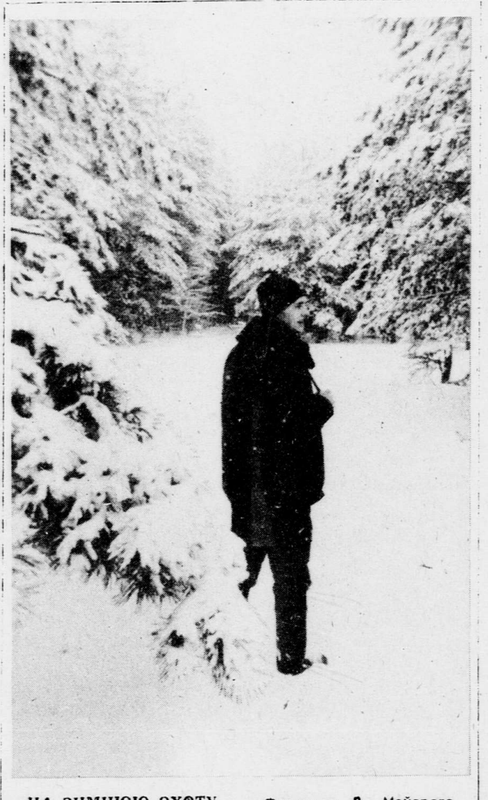
НА ЗИМНЮЮ ОХОТУ.