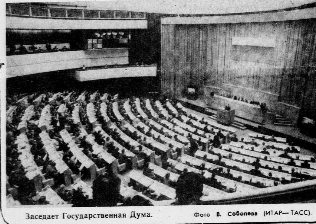
Заседает Государственная Дума.