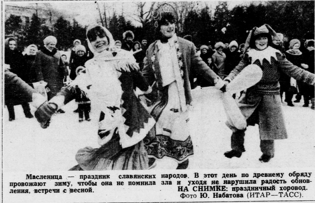
Масленица — праздник славянских народов. В этот день по древнему обряду прожигают зиму, чтобы она не помнила зла и уходя не нарушила радость обновления, встречи с весной.