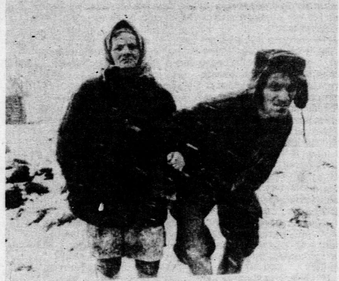
На снимке: на поминках по убиенным воинам в селе Черкасках Саркатынского района.