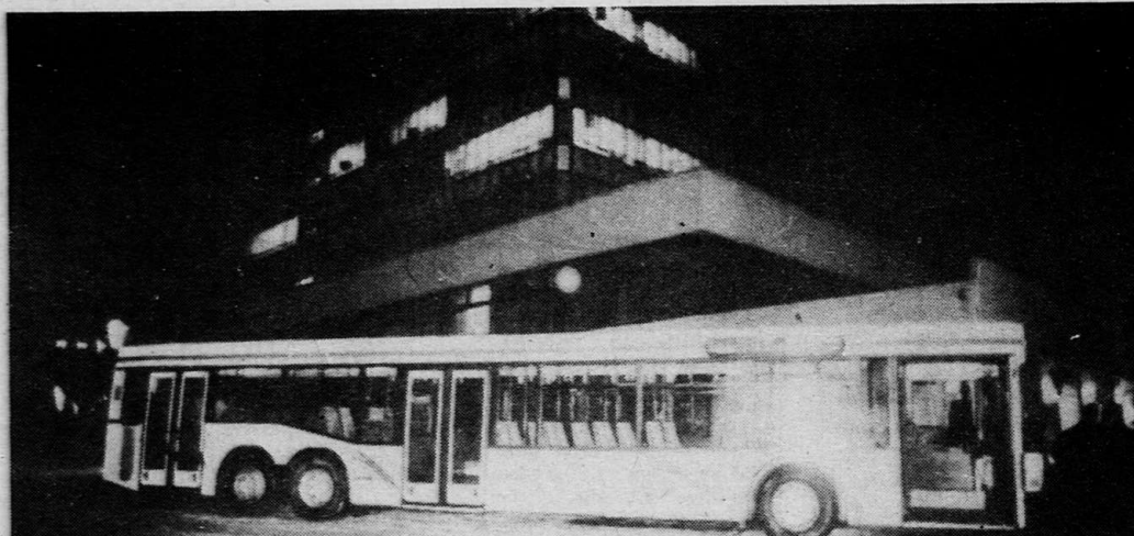
На заводе имени Лихачева состоялись пробные испытания немецкого пассажирского автобуса фирмы «Неоплан». Планируется, что эти автобусы будут производиться на ЗИЛе, причем первая машина сойдет с конвейера уже в 1996 году.

— Какое отношение к созданию политической партии «Союз отечества» и начаты консультации с движениями и организациями, которые поддерживают эту идею. Я думаю, что в ближайшие два-три месяца такая организация будет создана. — Многие политические партии России разнятся друг от друга только своим отношением к тем или иным аспектам экономической реформы; национальный же вопрос власти и политические партии стараются не поднимать и уж тем более не декларировать в качестве программы действий. Правильно ли я понял, что национальная идея будет главной для новой партии? — Бедой всех политических партий, включая «Выбор России» и «Гражданский союз», является то, что они эту идею не понимают. Если речь идет о выживании России, если речь идет о понимании национальных интересов, а есть лишь досужие разговоры об общечеловеческих интересах, значит, государство остановилось в своем развитии и в дальнейшем будет разваливаться. Поэтому сейчас надо говорить о главном.