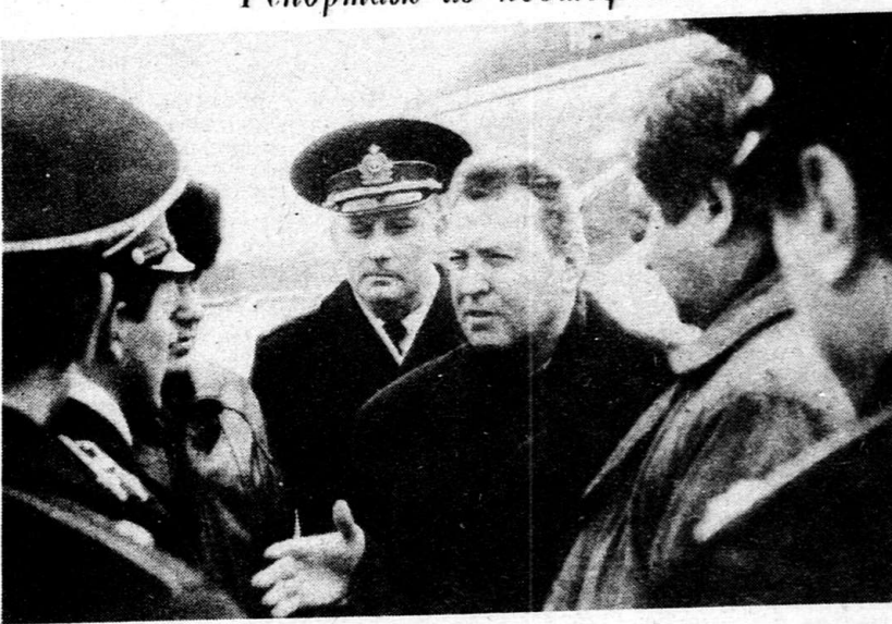
Репортаж из подшефного авианолка