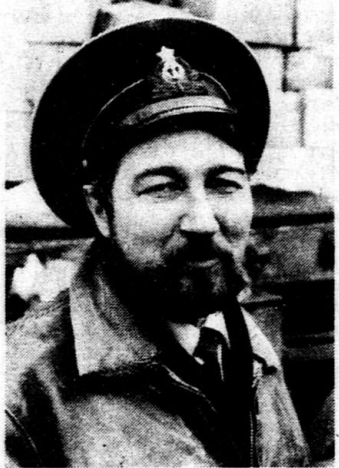
Вслед за событием