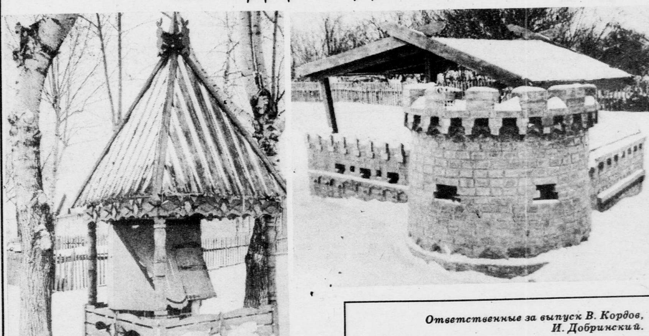
Ответственные за выпуск В. Кордов, И. Добрицкий.