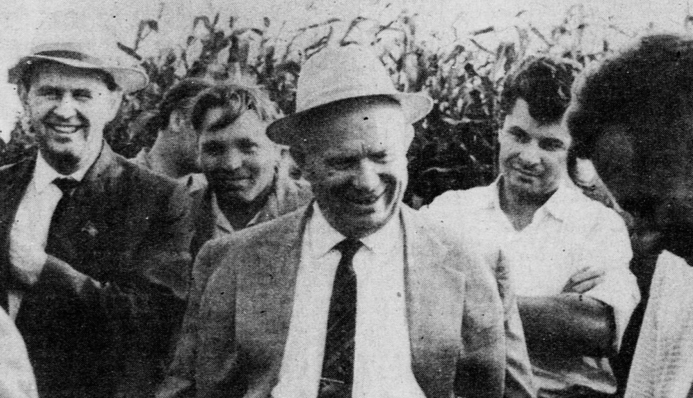
К 100-летию со дня рождения Н. С. Хрущева

Паис: Это трудно предсказать. Он в очень сложном положении теперь оказался. У него нет собственных людей.