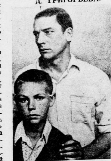
Кадр из фильма «Пацаны». Репродукция Ф. Алексеева.

просмотров — «Хоро новус», «Пустельга», «Мамта Роза».