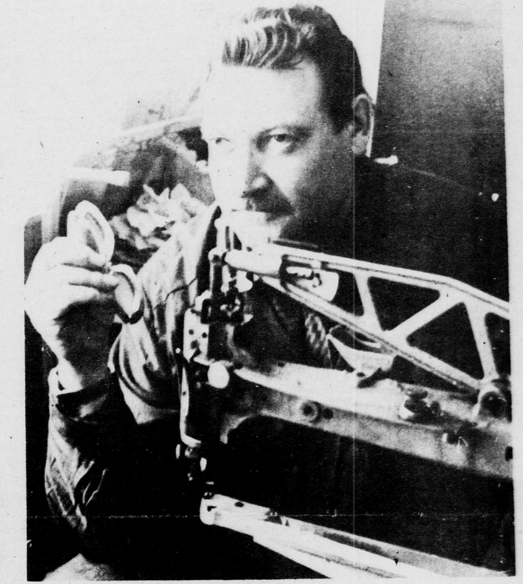
Нужные всем и каждому

— Могу ответить однозначно — все сделано для того, чтобы вероятный ущерб от паводковых вод был минимальным. В целях своевременной подготовки гидротехнических сооружений на реках, прудах, сохранении от затопления и разрушения водной промышленности и коммунальных предприятий, жилых зданий, линий связи и объектов энергосбережения поставленным главы администрации создана и уже действует противопаводковая комиссия, председателем которой назначен зам. главы администрации области, директор департамента административных органов В. Ф. Ковалев. Комиссия уже провела заседания на прошлой неделе и теперь будет постоянно собираться по пятницам в 15.00. Где будут заслушиваться наряды различных служб по готовности к наводнению. По сообщению начальника Воронежского центра по гидрометеорологии и мониторин-