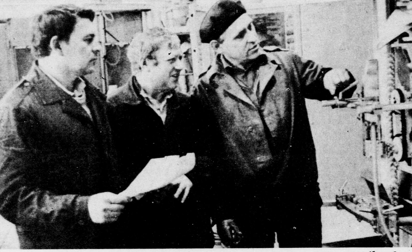
Завод встречает юбилей. Продукция Воронежского акционерного предприятия открытого типа (бывший завод имени Ленина)...