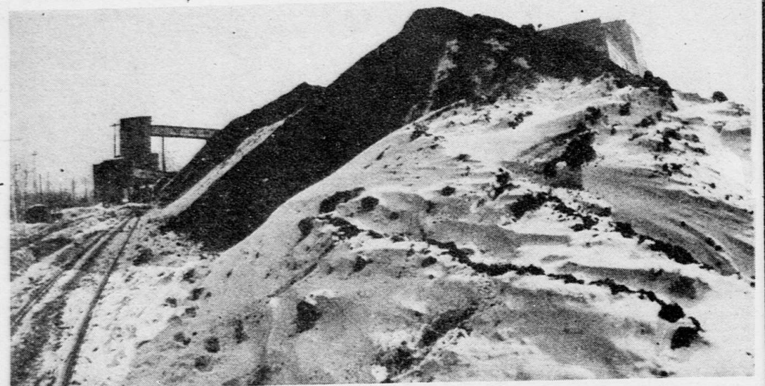
НОВОКУЗНЕЦК. Десятки миллионов тонн коксуемых и энергетических углей скопилось на складах шахт и разрезов Кузбасса. Невостребованный уголь тяжким бременем сказывается на экономике предприятий. НА СНИМКЕ: горы добытого угля скопились на складах шахты им. Димитрова АО «Кузнецкуголь».