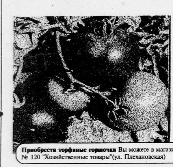
Приобрести торфяные горшочки Вы можете в магазине № 120 «Хозяйственные товары» (ул. Плехановская)