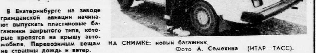
В Екатеринбурге на заводе гражданской авиации начинают выпускать пластиковые багажники закрытого типа, которые крепятся к крышу автомобиля. Перевозимым вещам не страшны дождь и ветер. НА СНИМКЕ: новый багажник.