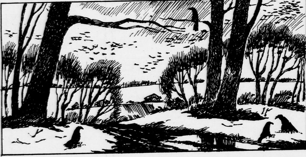
Рисунок В. Гагрилово.

Тысячи людей по всему миру заявляют о том, что видели непознанные летающие объекты (НЛО), указывают места их появления. Однако свидетельства очевидцев слишком субъективны и в глазах ученых выглядят недостаточными для объективных данных. Найти методы научного исследования интересующих нас объектов. Но НЛО неуловимы, новости какой-то эксперимент с ними непосредственно вряд ли реально. Как же быть?