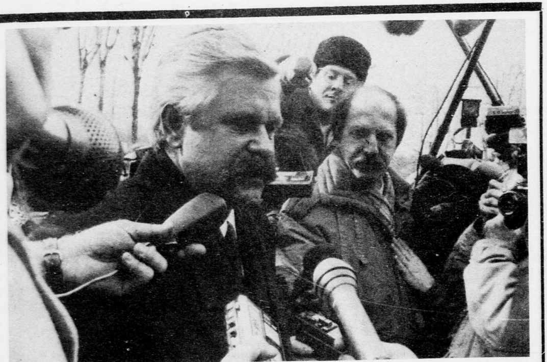
МОСКВА. Бывший вице-президент РФ, бывший узник Лефортова Александр Ручкой посетил выставку «Распродажа» (сельхозбудуование) на территории ВВЦ. НА СНИМКЕ: во время посещения выставки.