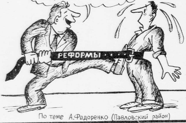
По теме А.Федоренко (Павловский район)