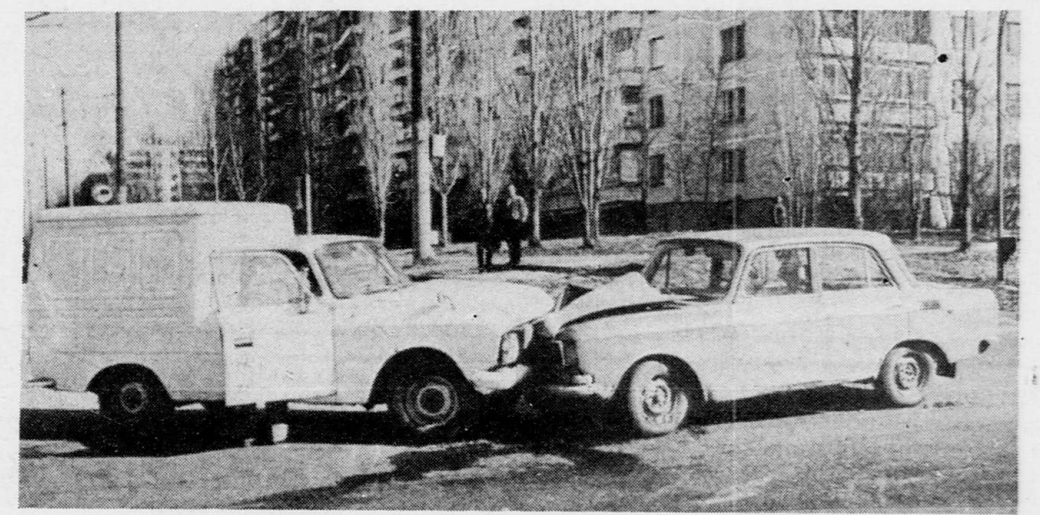
«Поцелуй» на дороге...