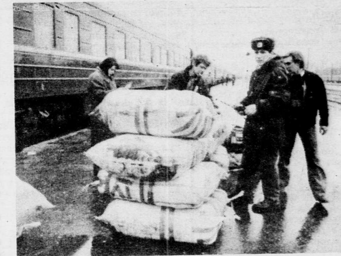
Одной из лучших по организации и результативности признана среди таможенных служб России работа Бранской таможни. Ее молодой коллектив поставил жесткий барьер промывочнику в страну контрабанды. За 6 месяцев 1993 года (период организации и становления) в федеральный бюджет было перечислено 4,8 миллиарда рублей и 3 миллиона долларов. Почти четверть нынешнего года федеральным властям за первый квартал задерживают груз «челноков» из-за неуплаты таможенной пошлины.

На Валуйском сахарном заводе Белгородской области бывали специалисты из Опольского воеводства Польши. Двадцать лет назад они осуществляли тут шефский контроль за монтажом оборудования - завод строился по польскому проекту. С тех пор много воды утекло. Заводская «начинка» на двести обновилась более современным отечественным и иноземным оборудованием. Заводчане только в последние годы «нарушили» проект пристройкой новых объектов - крупного склада готовой продукции, бетонного завода, кондитерского цеха.