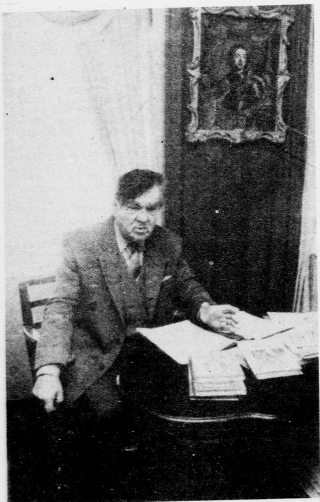
«Л. Толстой. 2 апреля (1894). Воронеж».