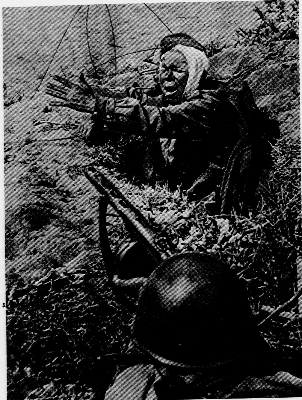
Полтрук продолжает бой.