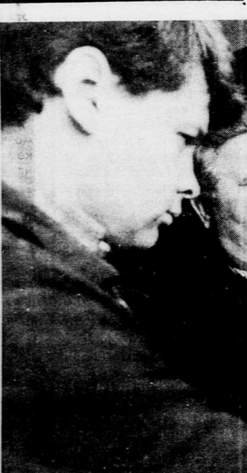
Культура на селе