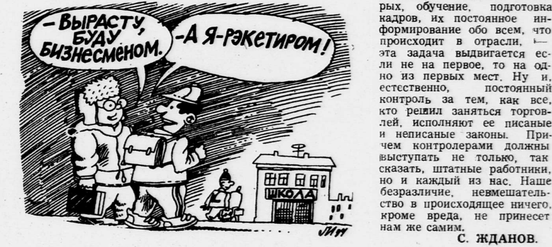
Рис. И. Левитина.