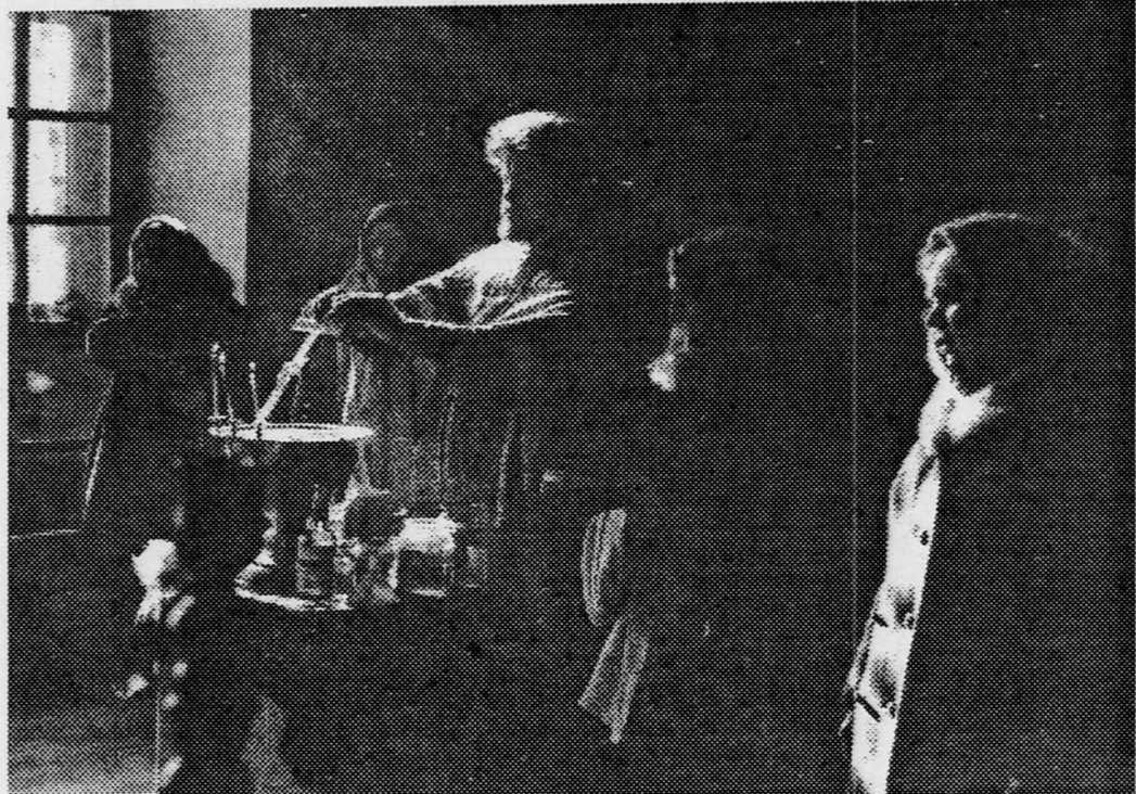
В сельской церкви.

Ю. ЕРМАКОВ, соб. корр. «Коммуны». Терновский район.