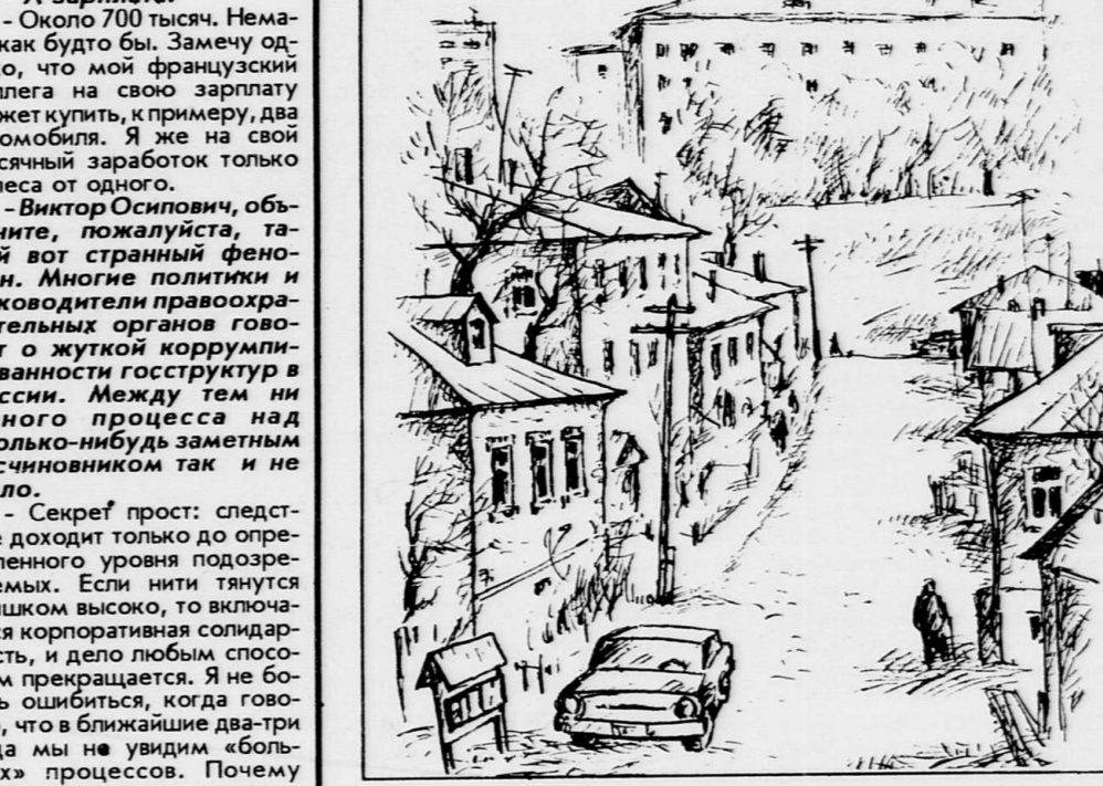
Воронеж. Улица Парская. Рисунок В. СЫСУЕВА.

Беседу вел обозреватель «Коммуны» Борис ВАУЛИН.