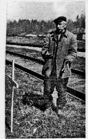
ТОМСК. Несколько газет сообщили, что есть свидетельства о неизвестном до селе захоронении, осуществленном в период сталинского правления. Зимой военного 43-го вблизи станции Томск-2 из состава скрытно были извлечены трупы и сброшены в яму. По весне в этом месте находили пуговицы и обрывки одежды, предполагалось, что здесь захоронены поляки.

ВАЛЕРИЙ КОНДАКОВ. «РАБОЧАЯ ТРИУНА». Печатается в сокращении.