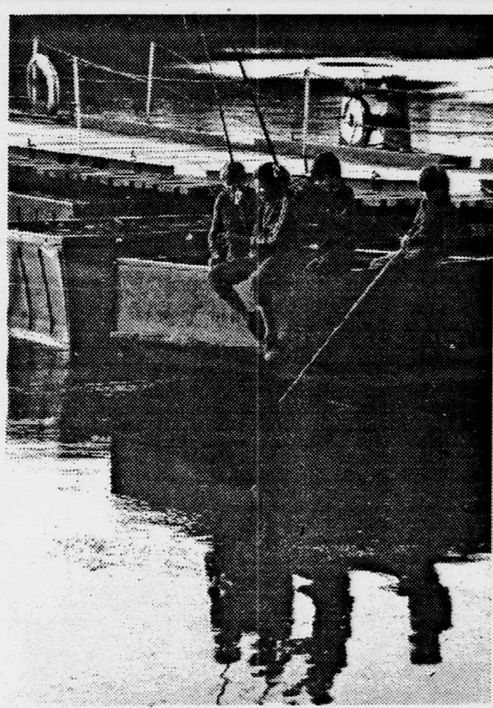
А у «неорганизованных» ребятшек одним из любимых занятий остается рыбалка.

В управлении Федеральной почтовой связи Воронежской области подведены итоги подписки на газету «Коммуна» с доставкой во втором полугодии 1994 года. Наилучших результатов добились подворенские почтовики: каждый восьмой житель района подписывает газету «Коммуна». На втором месте - кантемировцы: «Коммуну» выписывает каждый десятый. Почетное третье место за Таловским районом, где «Коммуну» по подписке получает каждый пятнадцатый. Напомним, подписка на газету «Коммуна» и ее приложение «Воронежскую пределью» с доставкой с 1 августа сл. принимается до 20 июля.