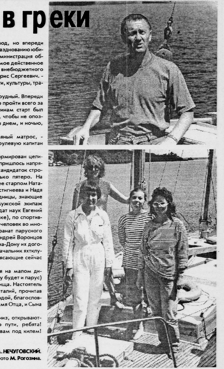
А. НЕЧУГОВСКИЙ.

Яхты медленно опускаются вниз, открываются ворота шлюза. Счастливого пути, ребята! Попутного ветра и семь футов вам под килем! До встречи в конце августа!