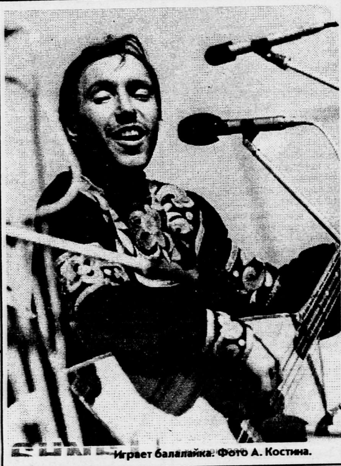
Игрет балалайка.