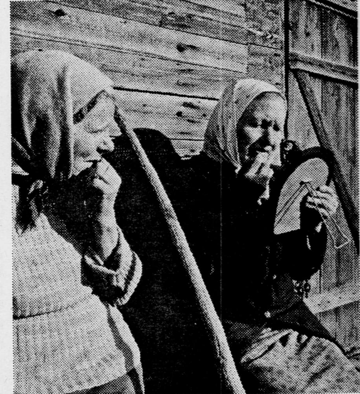
Женщина - всегда женщина.

На снимке: двухмесячный Юра еще не знает своей судьбы.