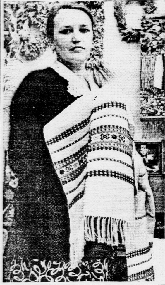
Почетный гражданин Воронежа