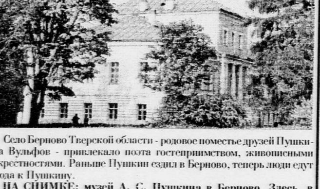
Село Берново Тверской области - родное поместье друзей Пушкина Вульфен - привлекало поэта гостеприимством, живописными окрестностями. Раньше Пушкины сели в Берново, теперь люди едут сюда к Пушкину.