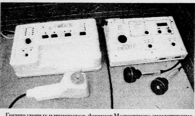
Группа ученых и инженеров-физиков Московского энергетического института вместе с учеными-медиками Московского медицинского института имени Семашко и НИИ скорой помощи имени Склифосовского на базе обособленного конструкторского бюро МЭИ - одного из ведущих предприятий по созданию космической техники - создали уникальную термометрическую систему, предназначенную для лечения широкого спектра заболеваний. «Милта» обеспечивает бесконтактное, безмаркировочное лечение широкого круга заболеваний в области кардиологии, гастроэнтерологии, пульмонологии, урологии, неврологии, хирургии, дерматологии, стоматологии и ряда других.