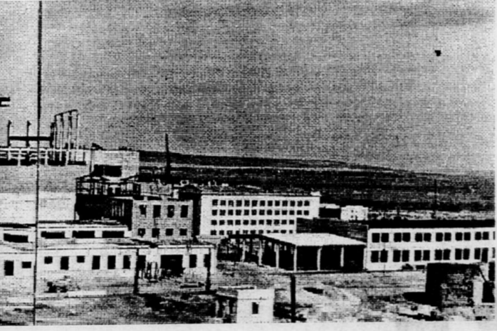
На снимках: главный инженер станции В.З. Зарубаев; июль 1960 г., панорама стройки НВАЭС.