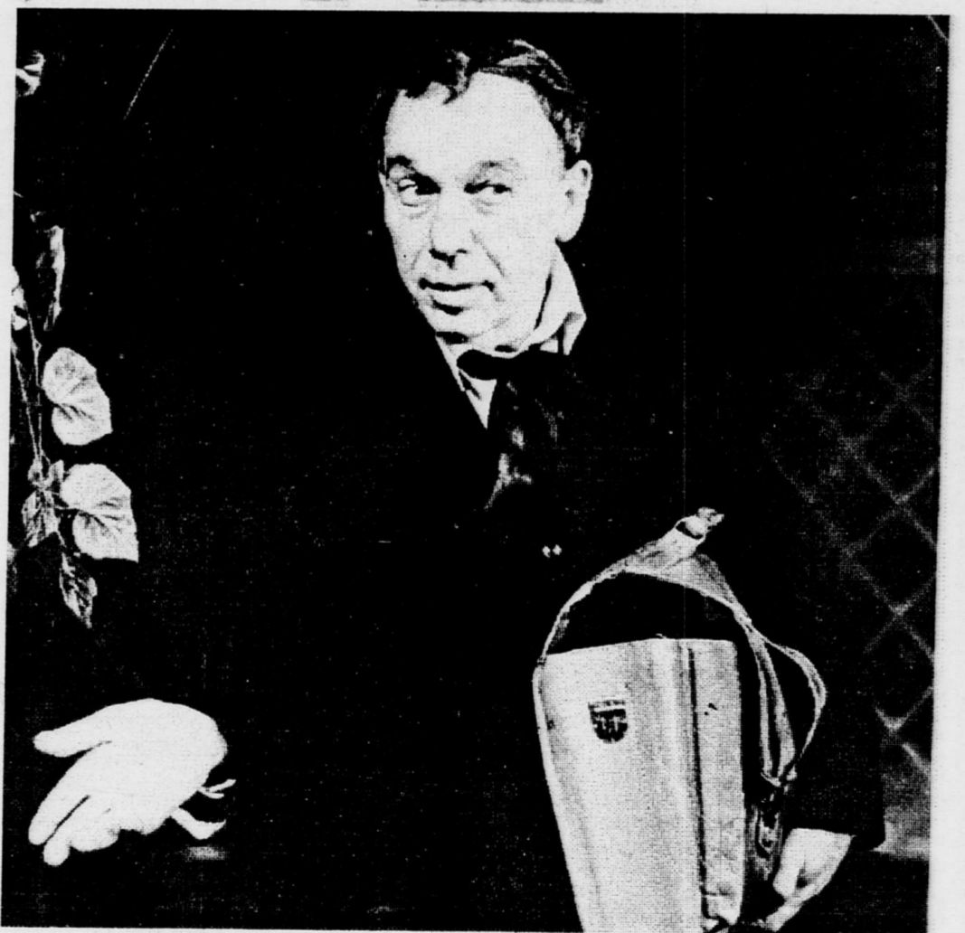
Народный артист России Вадим Соколов в спектакле «Резвые крылья амура...»

Нашим зрителям, конечно, интересуют и предметно творческие планы коллектива в новом сезоне. В конце октября планируется премьеры сразу двух русских водевилей первой половины XIX столетия. Это - Дмитрий Ленский - «Хороша и дурна, и глупа, и умна;