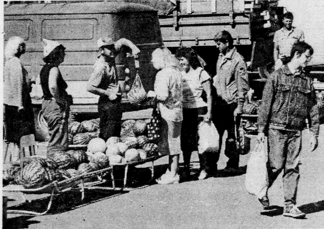
Октябрь - пора арбузов.

Организация реализует: - приспособления Змиевского для уборки подсолнечника на комбайны Дон-1500 «Нива»; - стогометатели ПФО, 5, 08; Телефоны: 55-38-31, 55-73-24, 55-17-86.