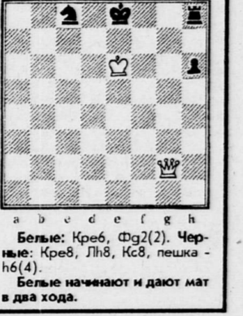
Белые: Кр6, Фg2(2). Черные: Кр8, Лh8, Кс8, пешка h6(4). Белые начегают и дают мат в два хода.