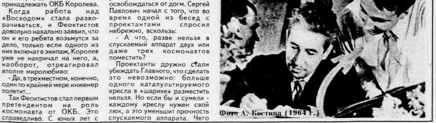
(1964 г.)