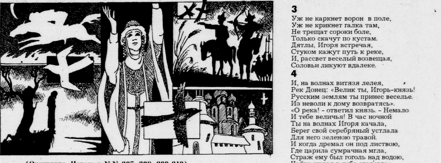
Рис. Виктора Гаврилова