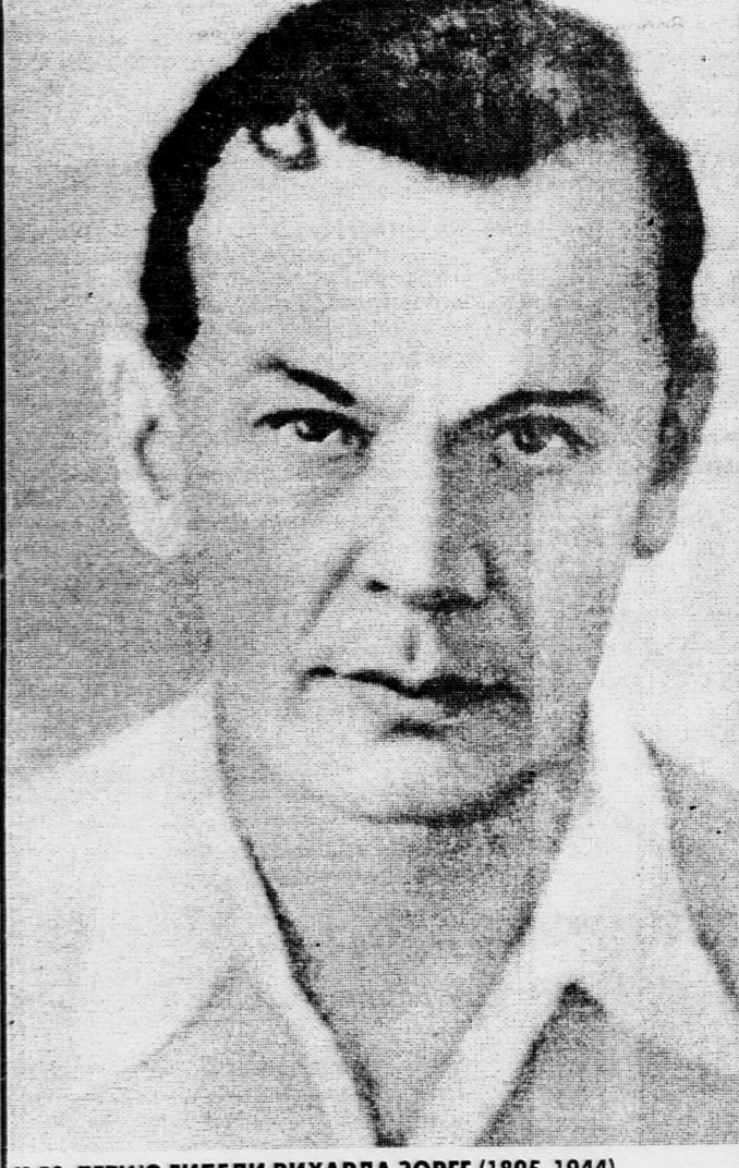
К 50-ЛЕТИЮ ГИБЕЛИ РИХАРДА ЗОРГЕ (1895-1944), СОВЕТСКОГО РАЗВЕДЧИКА, ГЕРОЯ СОВЕТСКОГО СОЮЗА Рихард Зорге, находясь в 30-40-х годах в качестве немецкого журналиста в Германии, Китае и Японии, добывал ценную разведывательную информацию. В 1941 году был арестован японской полицией и в 1944 году казнен. НА СНИМКЕ: Рихард Зорге.