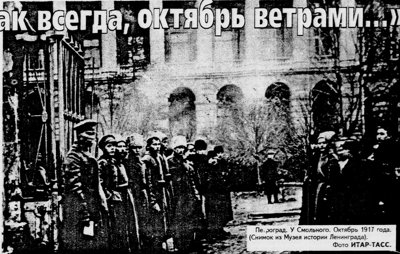
Пе. горад. У Смольного. Октябрь 1917 года. (Снимок из Музея истории Ленинграда). Фото ИТАР-ТАСС.

Накануне годовщины Октября редакция провела экспресс-опрос среди воронежцев о том, что значит он для них.