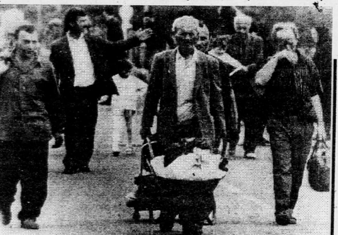
ТБИЛИСИ. Первые грузинские беженцы, перейдя мост через р. Ингури, в сопровождении наблюдателей ООН возвращаются в Гальский район в места своего постоянного проживания (на снимке).