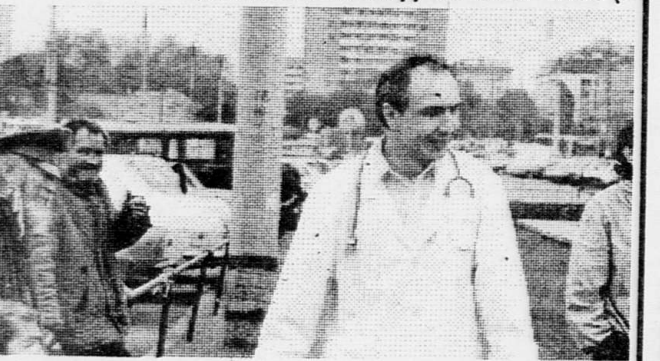
Мы долгое время смотрели на Запад, обращая свое внимание на их ноцлежки, армию спасения и прочие языки капитализма. Теперь мы почти на равных. Ноцлежки есть, закулочные - тоже. Очередь была за врачами - они не заставили себя ждать.