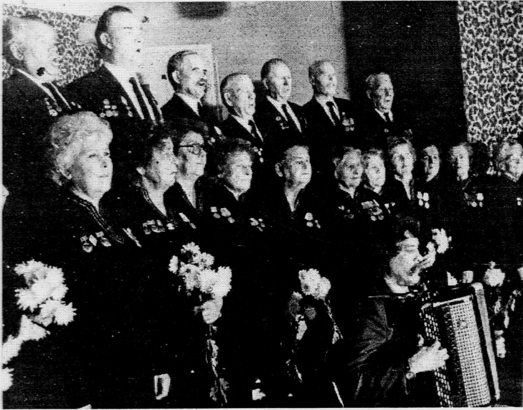
К 50-летию Великой Победы: помни, веруй, гордись