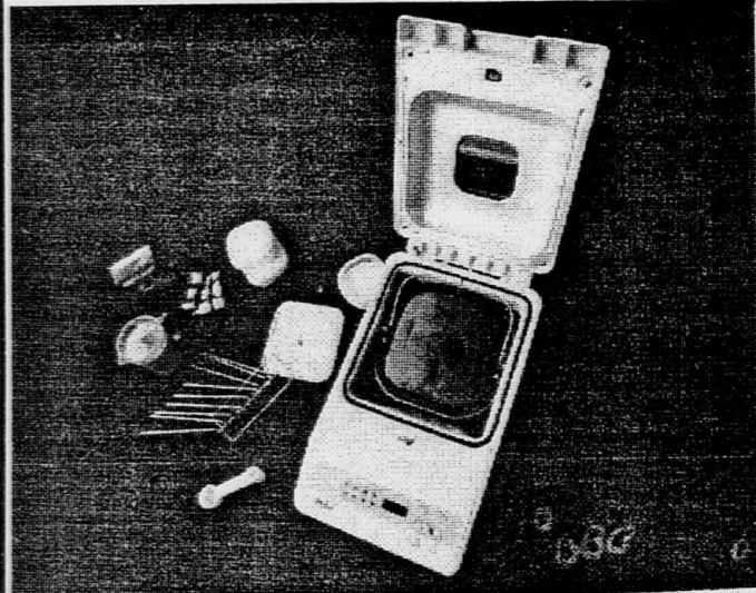
МОСКВА. Среди изделий бытовой техники, которыми торгуют московские магазины, все чаще стали появляться домашние хлебопеки. Различные модели хлебопечек для дома давно и хорошо себя зарекомендовали во многих странах. В России они появились недавно, но уже по достоинству оценены покупателями.

НА СНИМКЕ: Михаил Тимофеевич Калашников у себя дома.