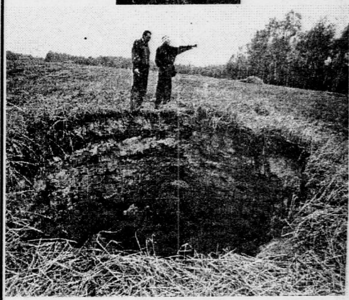
Многие на свете труднообъяснимы явлений, и в том числе это. Рядом с деревней Поречье Муромцевского района Омской области нашли жители на охотном поле две ямы. Весной, когда поле засеяли, их не было. Диаметр первой - пять метров и глубина четыре с половиной, диаметр второй меньше, зато глубина такая, что пятнадцатиметровая ересь с грузом два не достала. К этому стоит добавить, что жители деревни периодически наблюдают светящиеся объекты на небосклоне. НА СПИСКЕ: «черные дыры» у деревни Поречье.