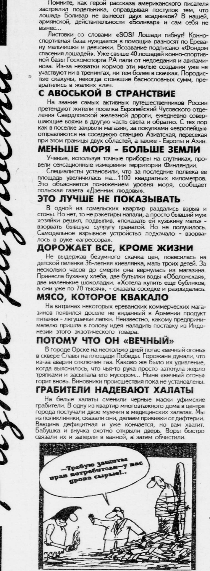
Рисунок В. ШИЛОВА. «Российские вести».