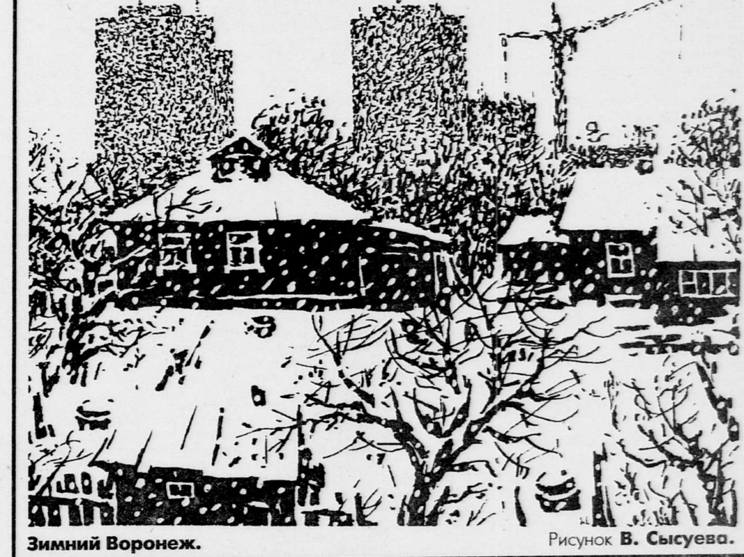
Зимний Воронеж. Рисунок В. Сысуева.