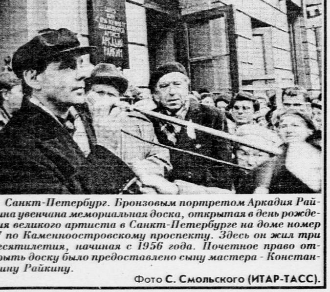
Санкт-Петербург. Бронзовым портретом Аркадия Райкина увековечена мемориальная доска, открытая в день рождения великого артиста в Санкт-Петербурге на доме номер 17 по Каленинсковоостровскому проспекту. Здесь он жил три десятилетия, начиная с 1956 года. Почетное право открыть доску было предоставлено сыну мастера - Константину Райкину.