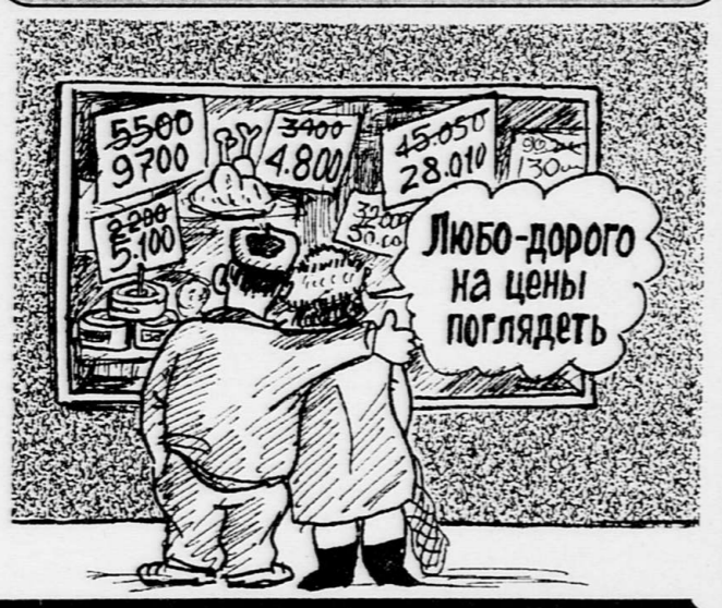
По сообщениям РИА «Новости». Информация получена по каналом связи компании «Информсвязь-Черноземье».