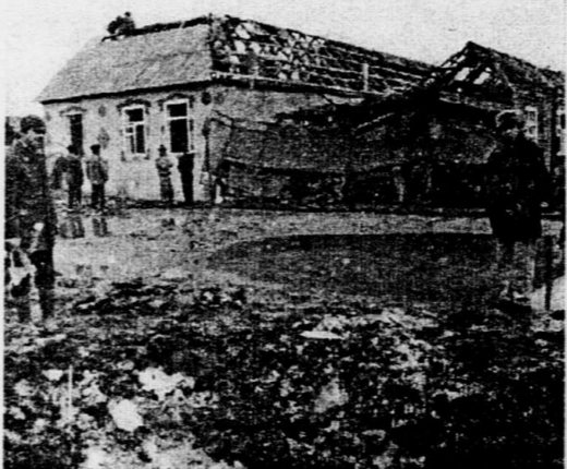
ЧЕЧНЯ. Разрушения в результате авиационного налета в Арзгуне.