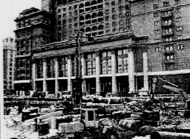
МОСКВА. Необычного вида сооружение появилось по соседству с Большим театром. Это - передвижной бетонный завод с высокой производительностью, предназначенный для строительных работ в котловане Манежной площади. Благодаря этому работы на стройке не прекращаются круглые сутки: растут этажи подземной Москвы.