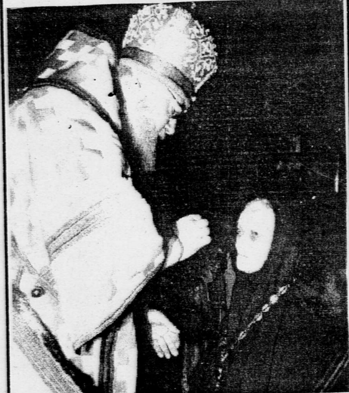
МОСКВА. По решению священного синода о возрождении сестринской монашеской жизни в Новодевичьем монастыре митрополит Крутицкий и Коломенский Ювеналий поставил в игуменьи монастыря монахини Серафиму. На сегодняшний день монахинь в монастыре нет.