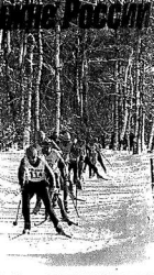
Вечером 10 февраля в центре Москвы на улице...