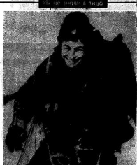
... Встретившись с космонавтом...