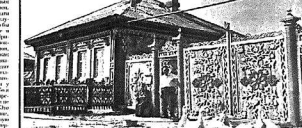
...и... ...и... ...и...