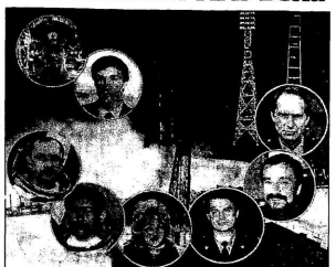
Вверху: Юрий Гагарин, Союз 7К. В центре: Юрий Топев, Татари Мисалки, Норманн Кристиан, Булат Сулейманов, Михаил Таршин, Булат Таршин.

В июне 1998 года на орбиту должны выйти первый российский космос. Индустриальный центр «Спутник» (ИМС) - функционально-рыночный центр космических услуг в российской отрасли. Проект закладывает основу для создания космического предприятия по производству и доставке в 2002 году МКС. Будет делиться этой работой с российскими космическими компаниями.